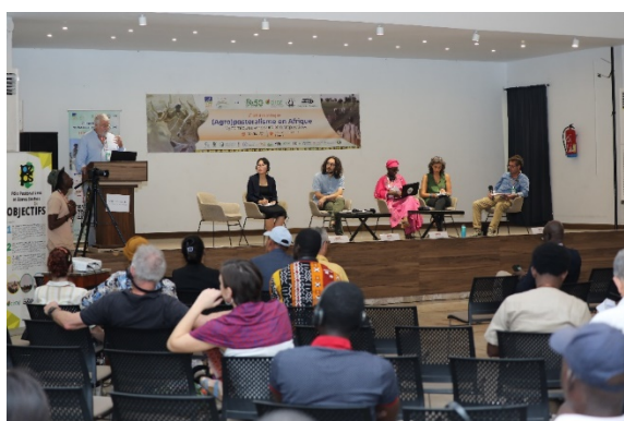
Table ronde l'(agro)pastoralisme dans le monde

Le dynamisme des modérateurs a rendu l'animation de ces sessions interactives et a permis de mettre en débat ces différents enjeux.