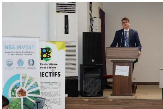
Side event Banque Mondiale